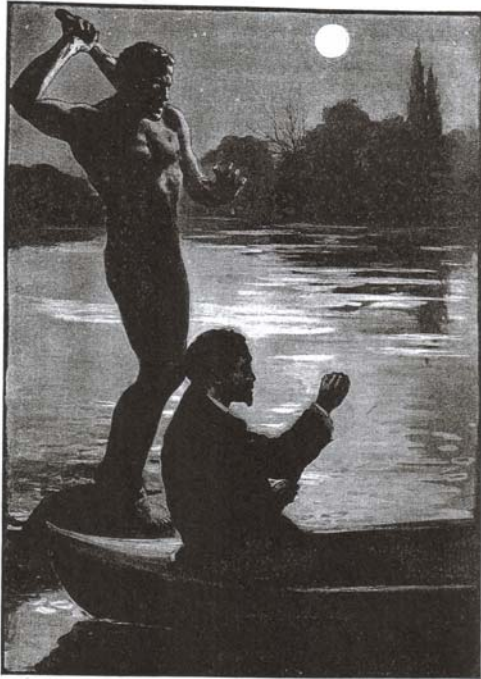
"IT WAS THEN THAT I REACHED FORWARD AND SMOTE HIM WITH THAT HEAVY CLUB." (See page 11.)

に勤んでいた。彼はイタリア貴族の末裔で、芸術家であり、Hampsteadの中世風の屋敷で暮らしていた。世界各地の芸術品に囲まれて、彼はブロンズ像に取り組んでいた。敷地内には池があり、夏にはよくカヌーを浮かべ、水上で散策していた。